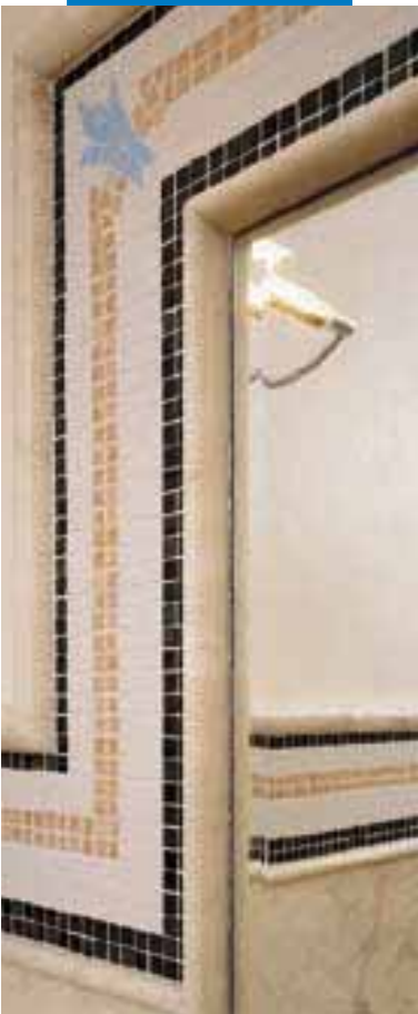
Esempio di decorazione eseguita con mosaico di materiali vari