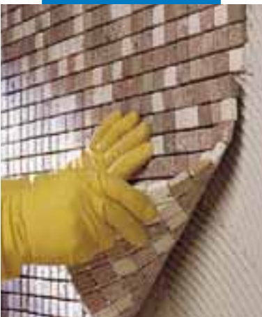
Posa di mosaico di marmo 2x2 a parete