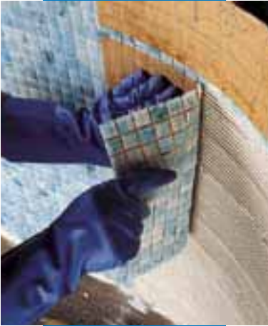
Posa di mosaico vetroso 2x2 in piscina con Adesilex P10 più Isolastic diluito 1:1 con acqua

Le fughe tra le piastrelle possono essere stuccate dopo 4-8 ore a parete e dopo 24 ore